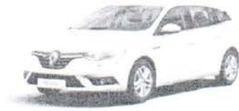
RENAULT MEGANE Grandtour